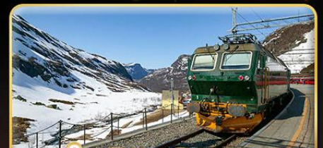
นั่งรถไฟสายโรแมนติก “พร้อมสปา”