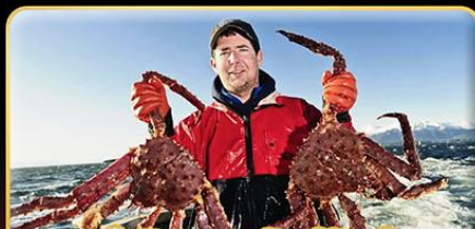
ทำกิจกรรมจับปูยักษ์ “พร้อมเมนูสุดพิเศษ”