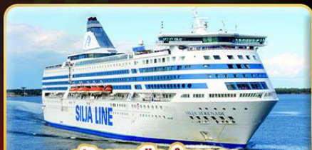
พักบนเรือสำราญ แบบ Window Room 2 คืน