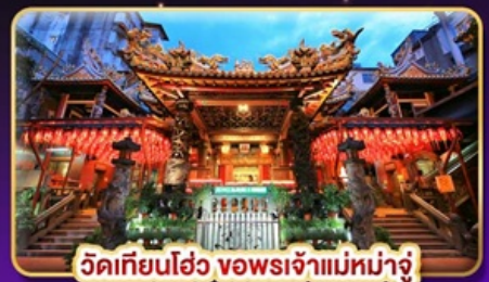
วัดเทียนฮั่ว ของพระเจ้าแม่หม่าจู