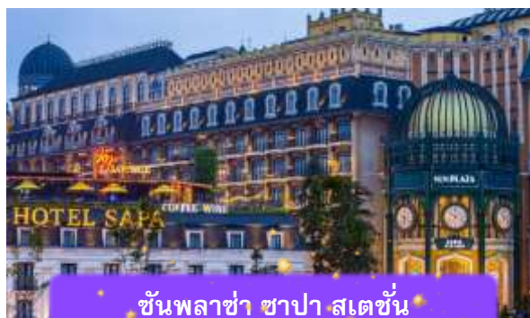
ชั้นพลาซ่า ซาปา สเตชั่น