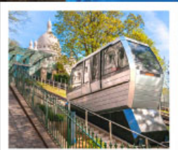
ขึ้นรถไฟสู่เมืองมาร์ต