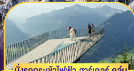
นั่งรถกระเช้าไฟฟ้า ชาร์เตอร์ คูส์ม