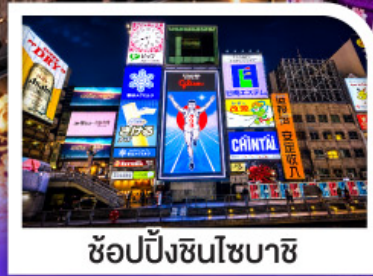
ช้อปปิ้งชินโจบาชิ