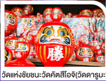
วัดแห่งชัยชนะ-วัดคัตสึโอะจิ(วัดคารุมะ)