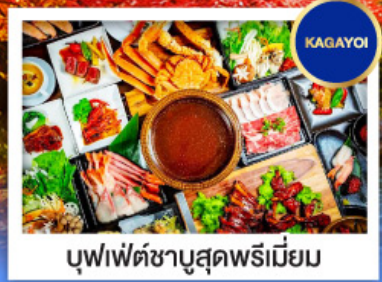
บุฟเฟ่ต์ชาบูสุดพรีเมียม