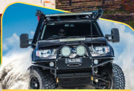
ขึ้นรถ 4WD สู้ใจกลางเทือกเขาคอเคซัส