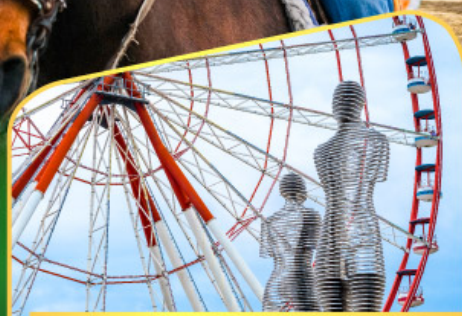
อนุสาวรีย์อาลีและนีโน่