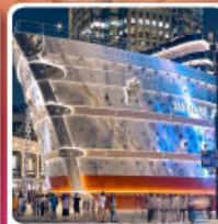
เรือหลุยส์