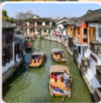
หมู่บ้านโบราณจูเจียเจียว