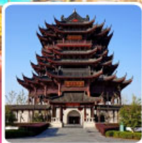
วัดดงหยวน