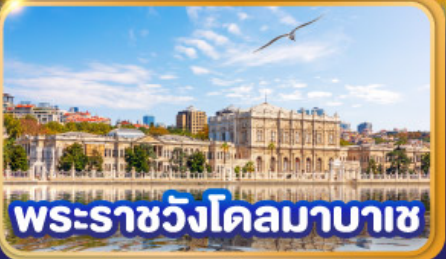
พระราชวังโดลมาบาซ