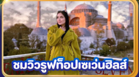
ชมวิวยุฟทือปเซเวนฮิลส์

📅 เดินทาง : 03-11, 10-18, 12-25, 22-30 ต.ค. 69 31 ต.ค. – 08 พ.ย. 69 / 07-15, 21-29 พ.ย. 69 03-11, 19-27 ธ.ค. 69 26 ธ.ค. 69 – 03 ม.ค. 70 30 ธ.ค. 69 – 07 ม.ค. 70