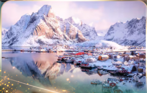
หมู่บ้านเรนเน

นอร์เวย์ แสงเหนือสุดฟิน เซ็คอินสุดว้าว 10 วัน 7 คืน