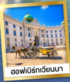
ออฟนิร์กเวียนนา