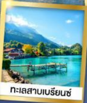
ทะเลสาบเบร์ฮินซ์