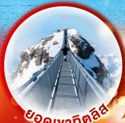
ยอดเขาคีทิลส์