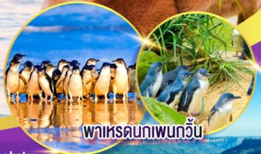
พาเหรดนกเพนกวิน

ล่องเรือชมอ่าวซิดนีย์พร้อมรับประทานอาหารกลางวัน และเข้าชมสวนสัตว์ทารองก้า