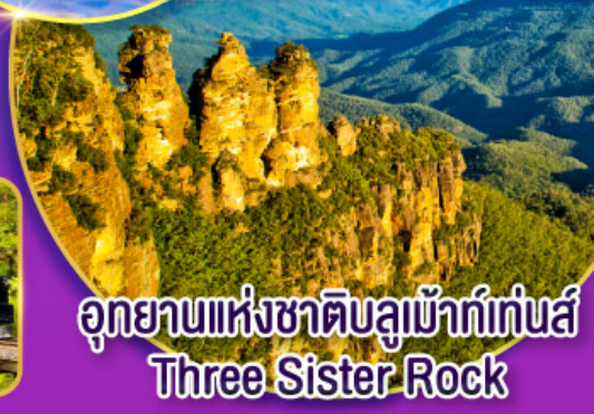
อุทยานแห่งชาติบลูเมาท์เทนส์ Three Sister Rock