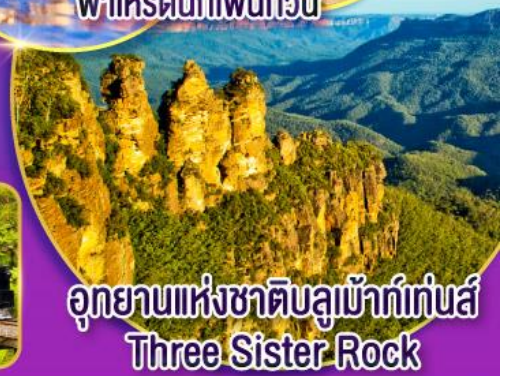
อุทยานแห่งชาติบลูแม้าท์เทนส์ Three Sister Rock