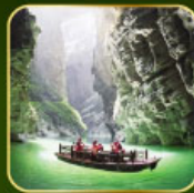
สวน Alice's Garden ล่องเรือแม่น้ำไต้ดินกูฮิว