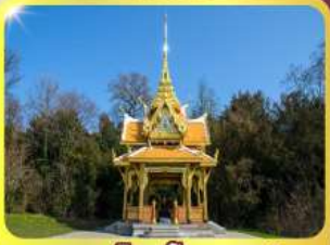
ศาลาไทยไชยาน์