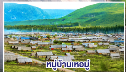
หมู่บ้านทอผ้า