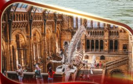
พิพิธภัณฑ์ประวัติศาสตร์ธรรมชาติ ลอนดอน