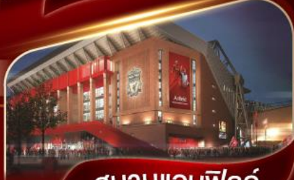
สนามแอนฟิลด์