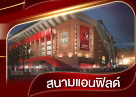
สนามแอนฟิลด์