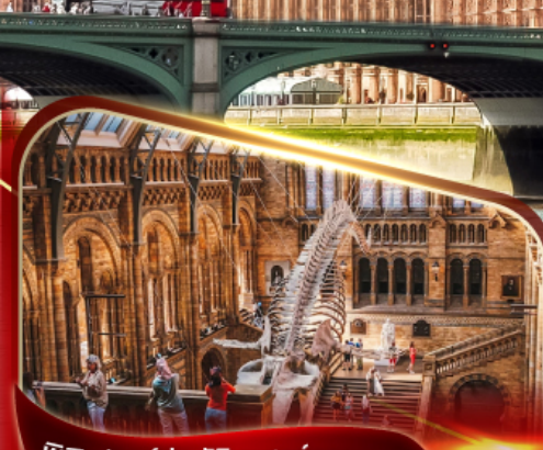
พิพิธภัณฑ์ประวัติศาสตร์ธรรมชาติ ลอนดอน