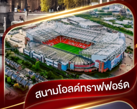
สนามโอลด์แทรฟฟอร์ด