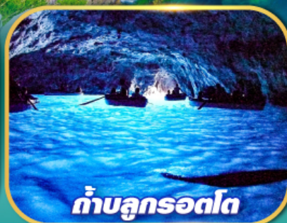
ถ้ำบลูกรอตโต