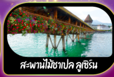
สะพานไม้ฆาปค ลูซิิร์น