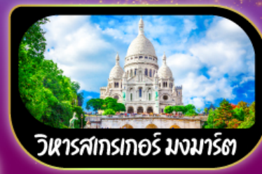
วิหารสกรเกอร์ มงมาร์ต