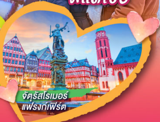
จัตุรัสโรเมอร์ แฟรงก์เฟิร์ต