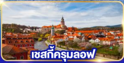
เซสท์ক্রุมลอฟ