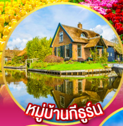
หมู่บ้านที่รูร์น