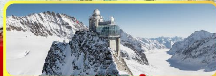
ยอดเทวจุ่งเฟรธา