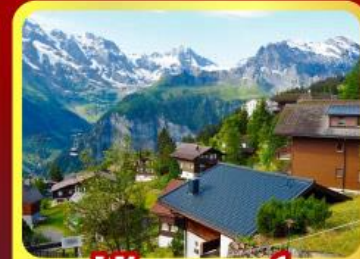
หมู่บ้านเมอร์เสน