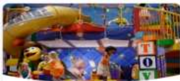
Disney's Oceaneer Club

วันนี้เรือสำราญ Disney Adventure จะล่องอยู่บนน่านน้ำสากลตลอด 2 วัน ท่านสามารถสนุกสนานพักผ่อนอยู่บนเรือสำราญที่มีกิจกรรมมากมาย ทั้ง สวนสนุกทั้ง 7 โซน ร้านอาหารธีม Disney และ Mavel ร้านขายของที่ระลึก ชมการแสดงจากหลายเวที แลพะกิจกรรมอีกมากมายทั่วทั้งเรือสำราญ