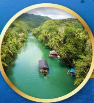
ส่องเรือแม่น้ำโลบ็อก