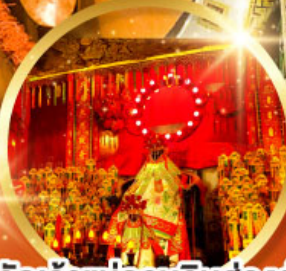
วัดเจ้าแม่กวนอิมอ่องอำ (สวนหนานเหลียน)