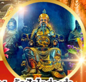
วัดปิกโต้อ่องอำ