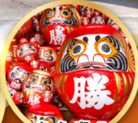
วัดคิตสึโองิ (วัดดามมะ)

ชมความงามของกำแพงหิมะ เส้นทางสายอัลไพน์ ทาคายามา (JAPAN ALPS SNOW WALL)