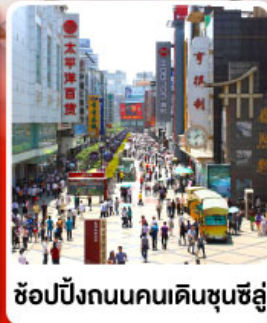
ช้อปปิ้งถนนคนเดินซุนซีลู่