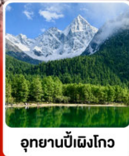
อุทยานπίงโกว