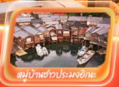
หมู่บ้านชาวประมงอิเกะ