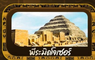
พีระมิดคีอซอร์