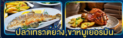
ปลาเทราต์ย่าง, จาห์มูเยอรมัน

Season Germany Austria Czech of romance.. Slovenia Hungary