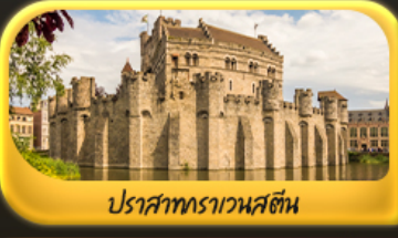
ปราสาทราเวนสตีล