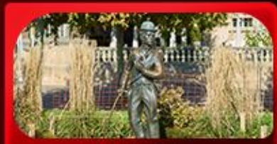
ชาร์ลี แชปลิน