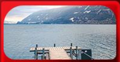
ทะเลสาบเบรียงพริ

สวิตเซอร์แลนด์แดนในฝัน ขึ้นยอดเขาจุงเฟรา พิชิต TOP OF EUROPE เดินเล่นเมืองเจนีวา เวย์รี่ ถ่ายรูปกับชาร์ลี แชปลิน และปราสาทซิลลองริมทะเลสาบ ชมความน่ารักป้อมหมีสีน้ำตาล ตามรอยซีรีส์ดัง Crash Landing on You ทะเลสาบเบเรียนซ์ สะพานไม้ชาเปล อนุสาวรีย์สิงโต หมู่บ้านเลาเทอร์บรุนเนิน น้ำตกเตาอบบาก น้ำตกโรนั้ เดินเล่นเมืองเก่า ช้อปปิ้งที่ถนนบานโฮฟสตรีทราเซอร์