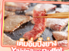
เค็มอบบิงย่าง Yakiniku Buffet