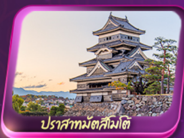
ปราสาทมัตสึมาตี