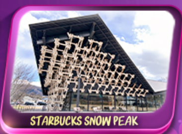
STARBUCKS SNOW PEAK

ครบทุกไฮไลท์เด่นๆ พรมสีชมพูผืนใหญ่ที่ฐานฟูจิซัง! เทศกาลชิชะซากุระ 1 ปีมีครั้งเดียว ชมความงามหมู่บ้านมรดกโลก หมู่บ้านชิราคาวาโกะ นั่งกระเช้าชมวิว Hakuba Iwatake สัมผัสธรรมชาติที่คามิโวจิ ป้อนเซมเบ็งองทวาง นารา ขอฟรุตโทโดจิ เช็ควินปราสาทโอซาก้า ปราสาทมัตสึมาตี วัดเบียวโดอิน ทะเลสาบซูวะ ถ่ายภาพป้ายกูลิโกะ Starbucks Coffee-Snow peak Land Station ปิดท้ายช้อปปิ้งย่านดัง ซินจูกุ