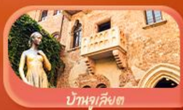
บ้านกุสียงต