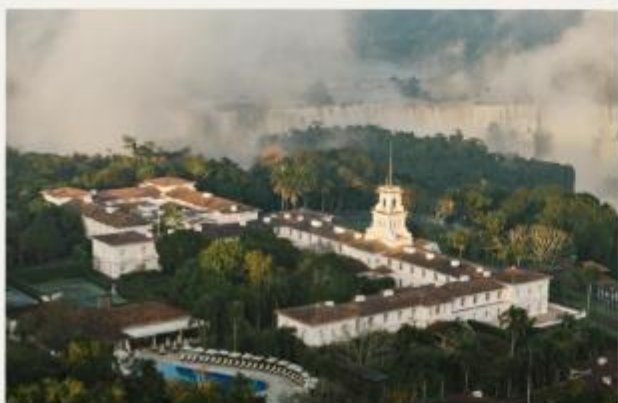
Hotel das Cataratas, A Belmond Hotel