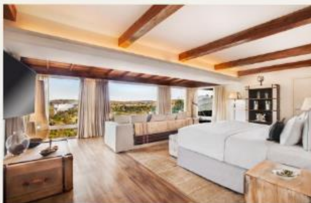
Gran Meliá Iguazú Argentina Side