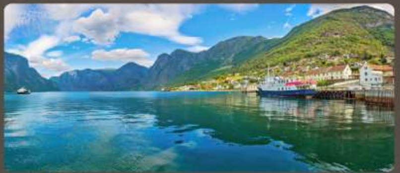
เส้นทางแสนสวย เมืองน่ารัก อากาศดีเยี่ยม

ทัวร์สแกนดิเนเวีย 10 วัน ชมทัศนียภาพที่สวยงามในการสัมผัสประสบการณ์แบบสแกนดิเนเวีย เริ่มต้นด้วยทัวร์เที่ยวชมเมืองโคเปนเฮเกน สํารวจเดนมาร์ก นอร์เวย์ ฟินแลนด์ และสวีเดน ในแต่ละจุดหมายปลายทาง การเดินทางด้วยรถโค้ช รถไฟ ชมวิว และล่องเรือชมวิฟยอร์ด สัมผัสประสบการณ์หมู่บ้าน ภูเขา และชนบทของเส้นทางในรูปแบบที่แตกต่างกัน พร้อมกับลิ้มรสอาหารท้องถิ่นหลากหลายเมนู