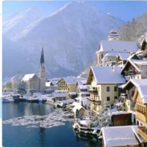
ออสเตรียบาวาเรียดินแดน แห่งเทพนิยาย