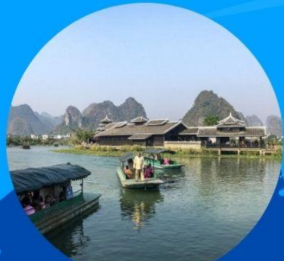
เมืองลับแล