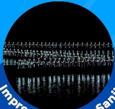
Impression of Liu Sanjie