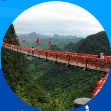
ภูเขาหลุย่