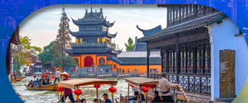
Zhujiajiao Ancient Town ล่องเรือเมืองโบราณ

เซี่ยงไฮ้ ดิสนีย์แลนด์ เมืองโบราณจูเจียเจียว