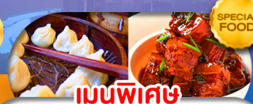
เมนูพิเศษ เสี่ยวหลงเปา หมูน้ำแดง เดินทาง ต.ค. 69 - มี.ค. 70