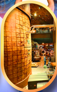
ร้านสตาร์บัคส์