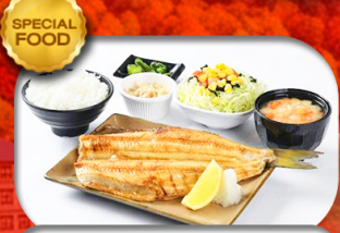
เมนูพิเศษ Set ปลาซอกเกะ