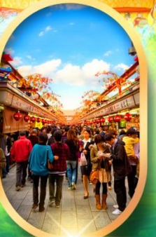
ถนนนากามิสะ