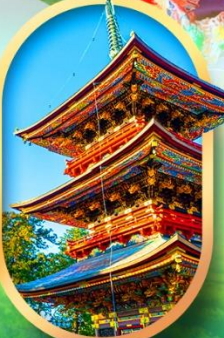
วัดนาริตะ-ซัง