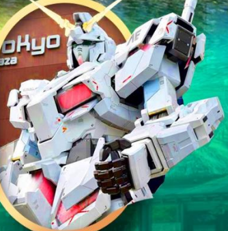
ห้างโอไดบะ-กันดั้ม