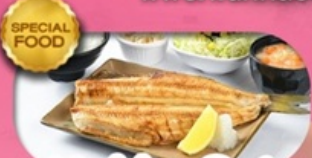
Hokke Set เซตข้าวปลาชอกเกะ