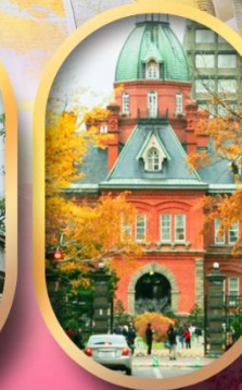
ศาลาว่าการเก่า