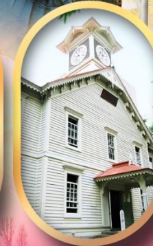
ผ่านชมหอนาฬิกา