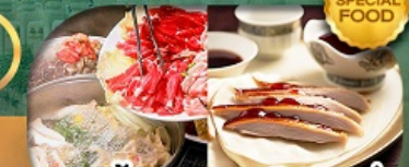
เมนู สุกี้มองโก + เปิดปักกิ่ง เดินทาง เม.ษ. - ต.ค. 69