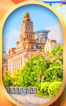
หาดไว่ทานเดอะบันด์