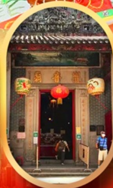
เจ้าแม่กวนอิมสองอ่า