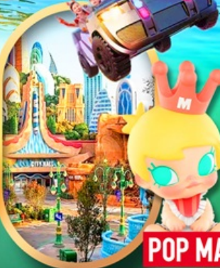
เลือกซื้อทัวร์เสริม เซี่ยงไฮ้ ดิสนีย์แลนด์