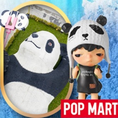
แพนด้าเซลฟี POP MART

เิงตุ สี่ครุณี จิวจ้ายโกว อุทยานระดับ 5A